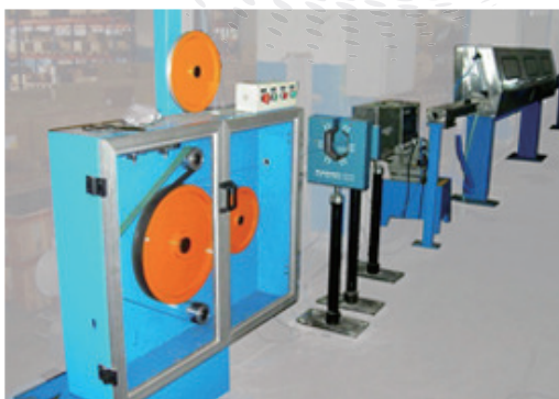
皮带牵引轮 Belt Capstan