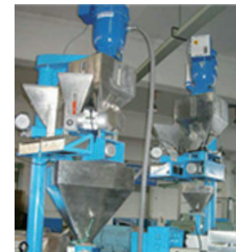
快速换色系统带塑料粒位控制系统 Quick color change system with plastic granule level control system