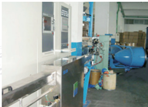
计算机化电控及瑞士仲巴赫在线控制系统 Computerized electric control and In-line control (Zumbach)