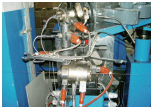
瑞士进口挤出机头 Swiss extrusion crosshead