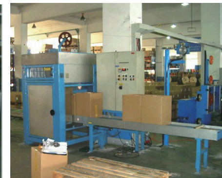
汽车线绝缘生产线成盒收线 Box coiler for insulation automotive wire