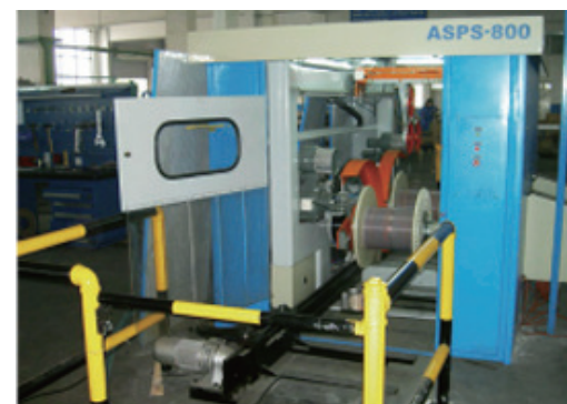
ASPS 800 全自动双盘收线装置 ASPS 800 Automatic dual take-up